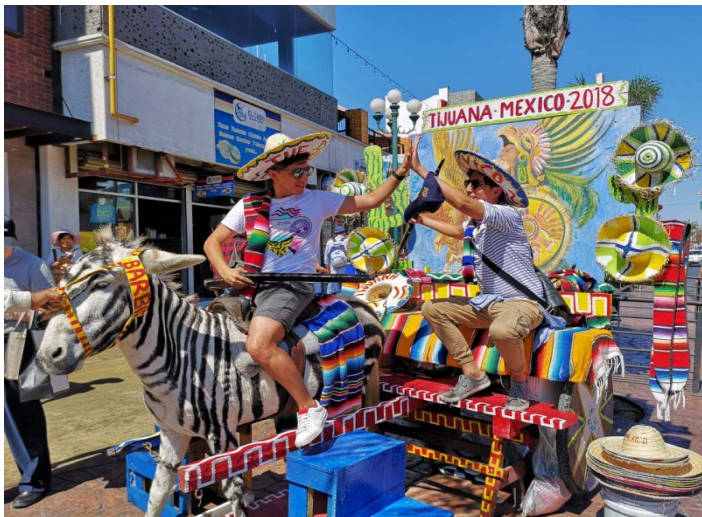
Figura 7: Turistas y el burro-cebra en 2018