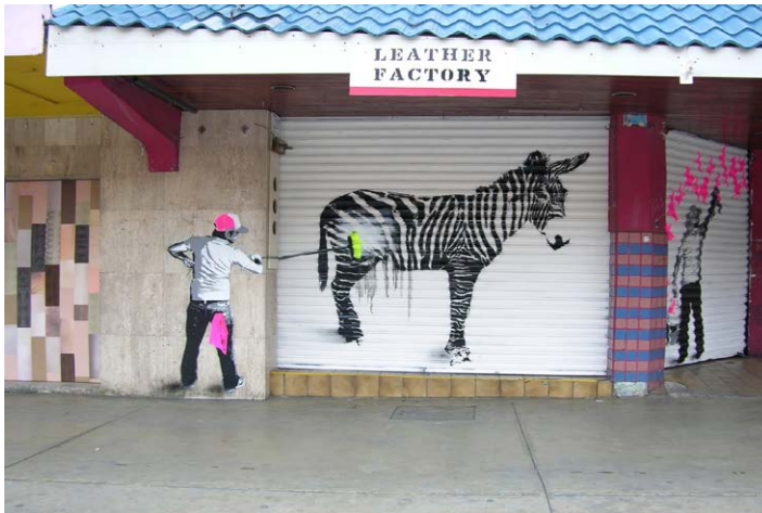
Figuras 6: Imagen urbana del burro-cebra en Tijuana.