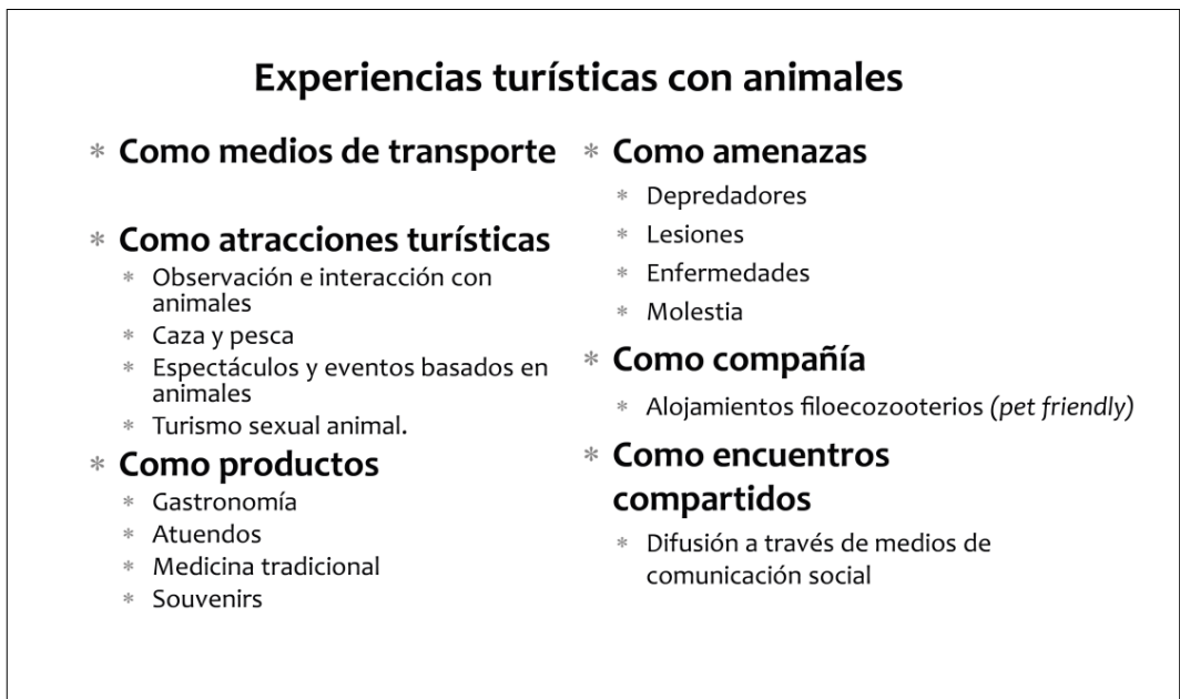
Figura 5: Experiencias turísticas con animales no humanos en el sitio de destino