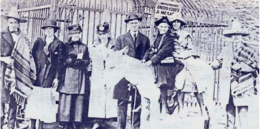
Figura 2: El burro de Tijuana en blanco y negro.