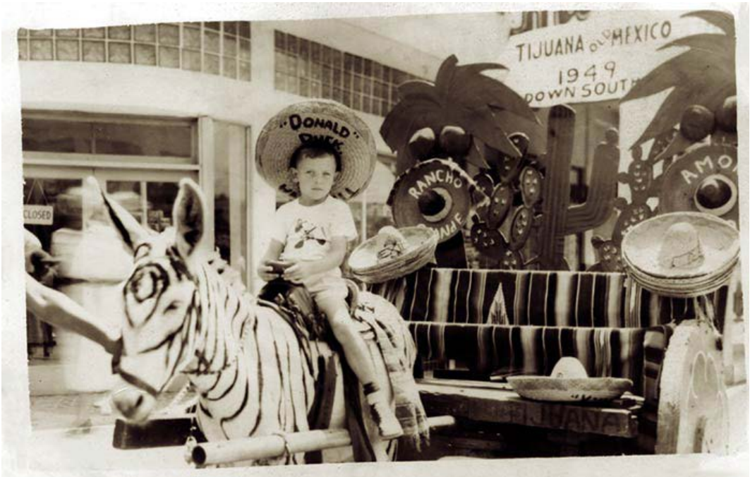
Figura 3: Un niño posando con el burro-cebra de Tijuana en 1949