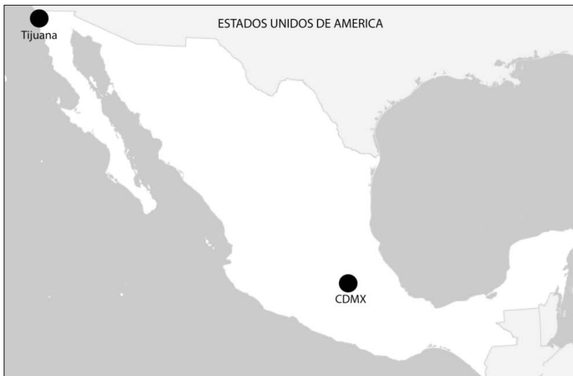
Figura 1: Localización de Tijuana en el noroeste mexicano.

Tijuana, con 2.1 millones de habitantes, es la quinta ciudad más poblada de México y la mayor urbe de Baja California (INEGI, 2018). Como ciudad global, forma parte de la aglomeración transfronteriza internacional San Diego-Tijuana y su crecimiento se debe al asentamiento de la industria maquiladora en el decenio de los setenta (Walker, 2011). Además, su situación fronteriza y de poca articulación geográfica hacia el centro del país ha hecho que la organización de su actividad turística dependa, casi en su totalidad, de los visitantes estadounidenses (Carmona y Correa, 2008) (Figura 1).